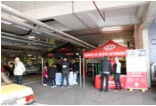
Richards plass var opptatt av boder i år