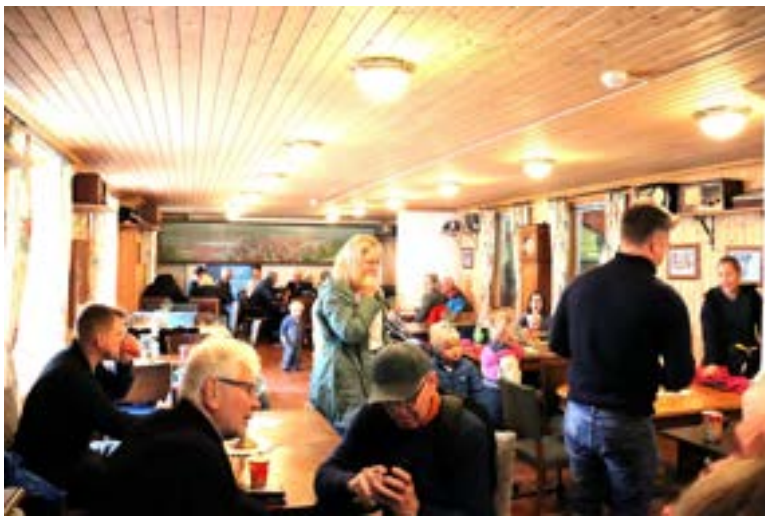
I kafeen var det også bra trøkk. Litt varme samt gode vafler.