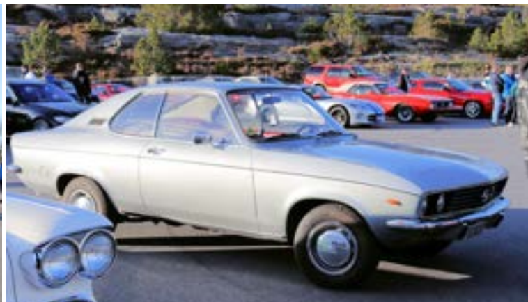
Sjelden vare nå: Opel Manta mk1. Var visstnok en 50 års gave!