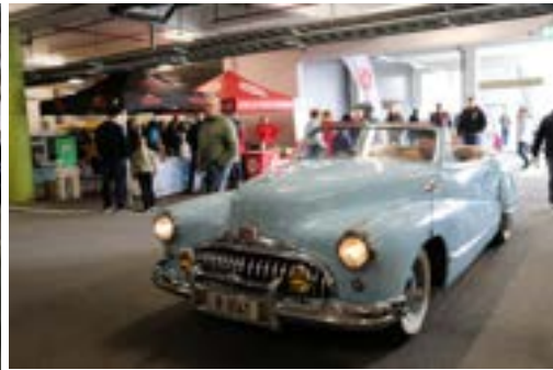
Bård og Bente Sørheim ankom sammen men i hver sin bil! Buick og Opel