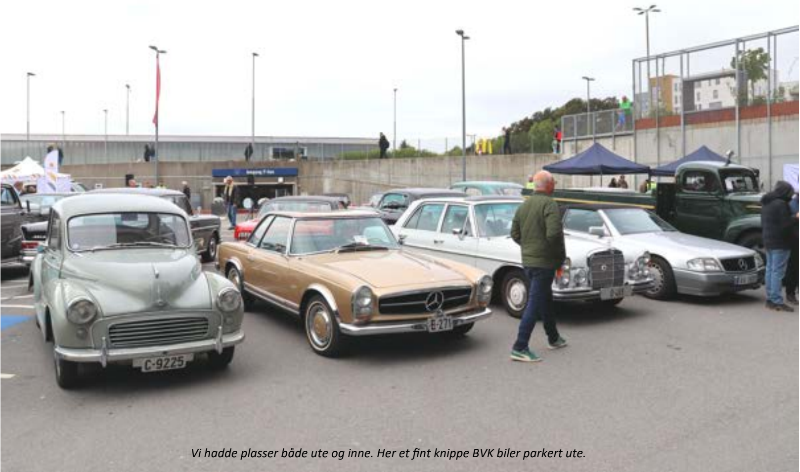
Vi hadde plasser både ute og inne. Her et fint knippe BVK biler parkert ute.