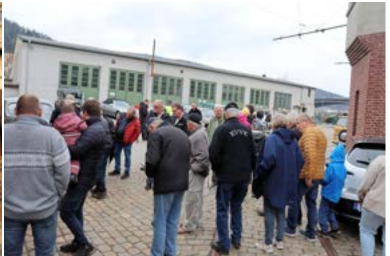
Hva tiltrekker mange voksne menn i slikt antall? Se under...