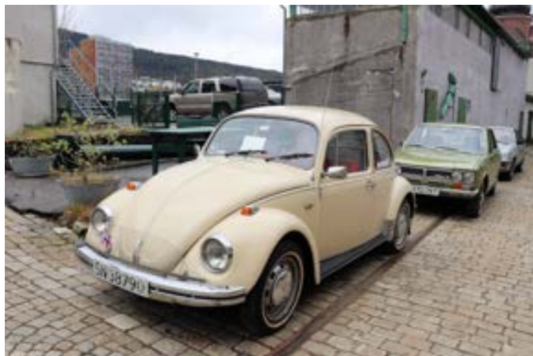
Kjell Toklum var på plass med sin VW