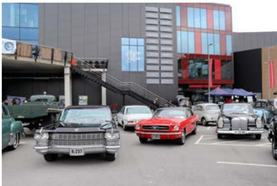
Uteplassen sett fra andre siden.

landet kom til å bli værvinnere denne 17. mai og påfølgende Kristi Himmelfartsdag med sol og bortimot 20 grader! Når dagen kom så kunne vi vel konstatere at vi var bortimot værtapere i stedet. Det eneste positive var at regnet holdt seg borte helt til kl 15 da arrangementet var slutt. Hva var da galt lurer du som ikke var der på? Vel, termometeret hjemme da jeg dro viste 3,6 grader og det var en isende nordavind. Så kanskje stevnet skulle hett «Senvintermønstring».... Ja, vi var godt kledde, men vi frøs. Det er ikke til å benekte!