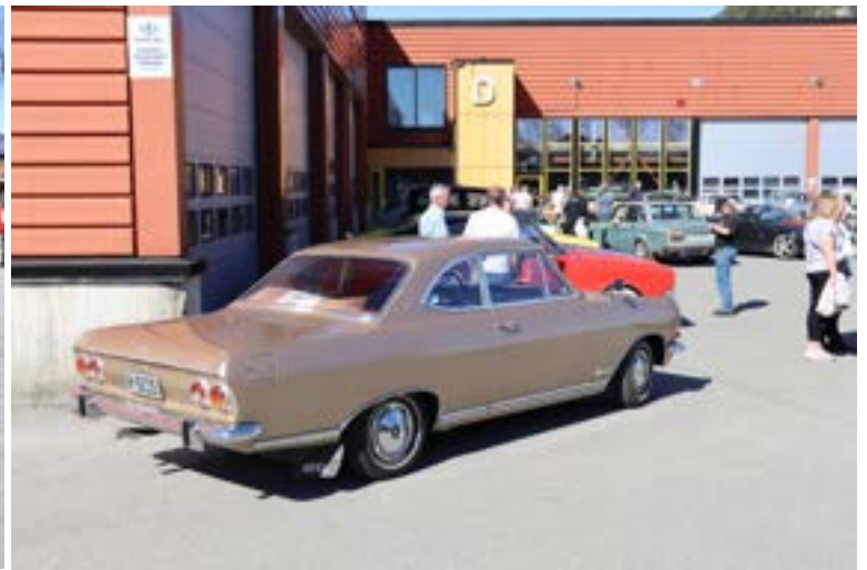
Denne Opel Coupeen var utrolig flott.