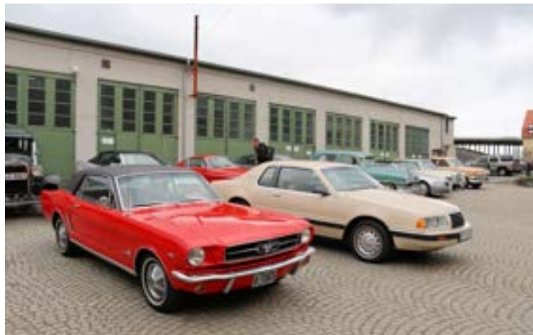
Fotografens og redaktørens biler er som oftest der når det er en reportasje fra arrangementet