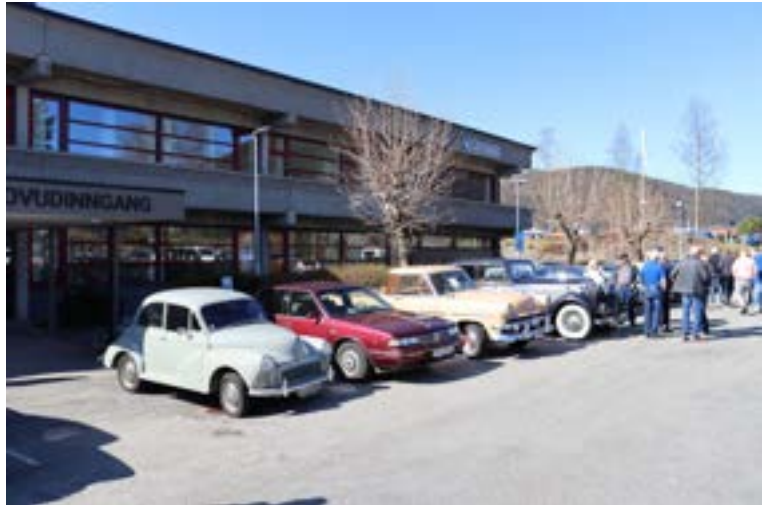
Det var egentlig en fin plass men som sagt i skyggen av arr.