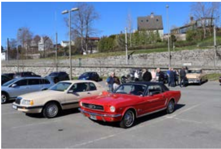
BVK medlemmer møttes på ESSO for samkjøring.