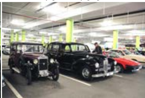
Engelsk rekke: Singer, Humber og Triumph.