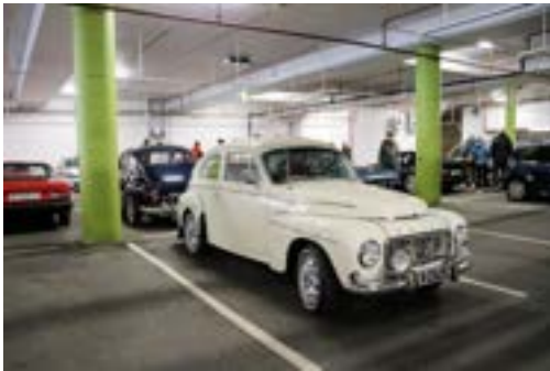
Herlig Volvo PV