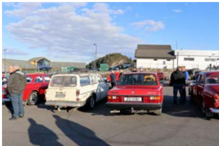
Strøkne Volvoer og en ikke fullt så strøken. Alt er velkommen.