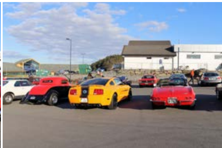
Rod (Stein Olav Bratten sin), moderne og klassiker!