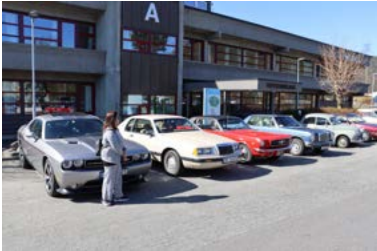
Vi ble parkert litt utenom allfarsvei