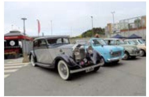
Fin samling av forskjellige fabrikat og årganger