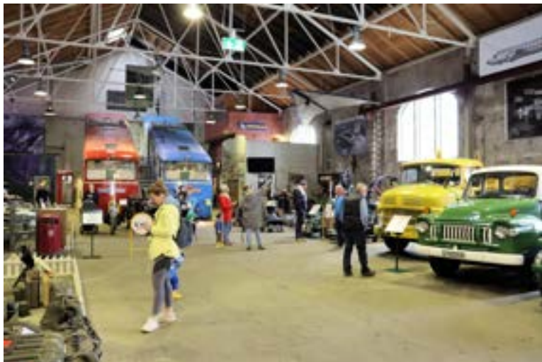
Stemningsbilde inne fra museet

fotograf Per Åge Hesjedal aktiv med kameraet, og jeg observerte og lagret i minne slik at denne artikkelen kunne skrives.