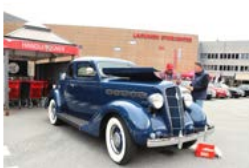
Eilif Harbitz-Rasmussen sin Plymouth