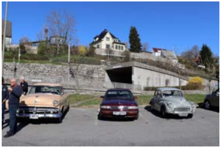
Forskjellige årsklasser representert.