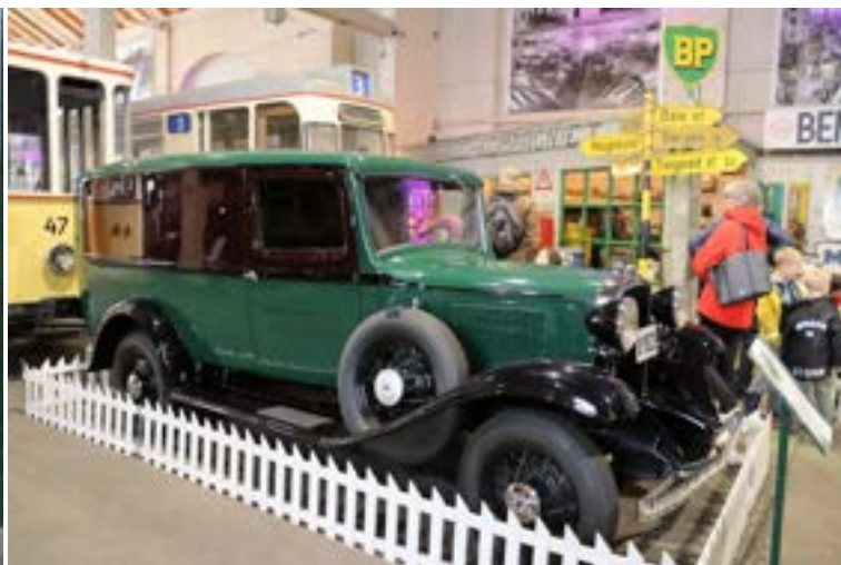
Kløverbilen er et fint innslag inne på museet

letten er inkludert i inngangsbilletten, og når vi som har vekten kommer gratis inn, så har vi ingen trikkebillett. Og det var ingen som visste om det var mulig å kjøpe utenom, noe det tydeligvis ikke var. En annen sak er for fremtidige åpningssøndager: Vil man komme gratis inn hvis man kommer med veterankjøretøy, og da faktisk lager utstilling for publikum? Det mangler tydeligvis noen retnings-