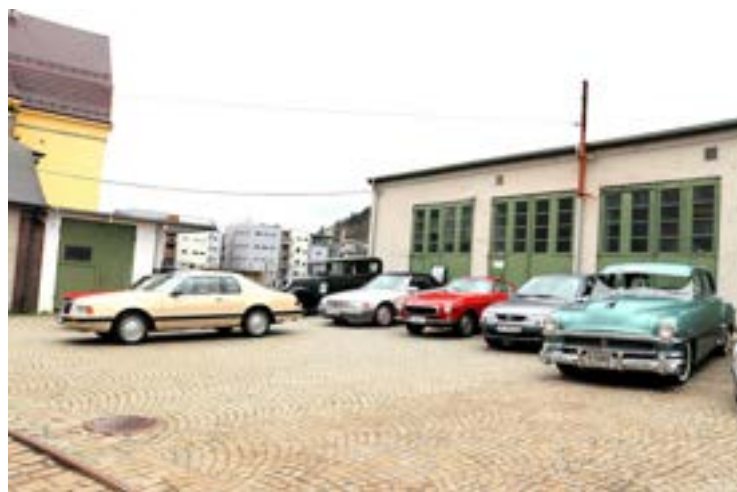
Flere av våre kjente, og et par ukjente, biler

denne gangen ikke sendte ut SMS på forhånd? Redaktøren er jo en av de som mener at hvis man er med i en klubb så må man selv følge med og søke informasjon om hva som skjer. Men, jeg må vel kanskje innse at i dagens samfunn så er det så mange konkurrerende tilbud at hvis man mandag har bestemt seg for å dra på BVK sam-