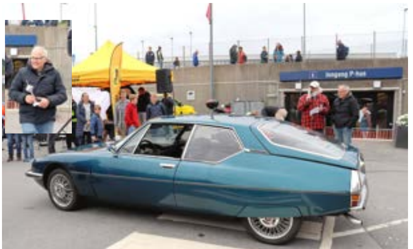
Beste veteran: Citroen SM med Maserati V6 motor på 170 HK. Karl, eller Kalle Wikse (innfelt bilde av eieren).

Arrangementet gikk ellers, fikk jeg inntrykk av, veldig bra. Vi lar bildene snakke mer.