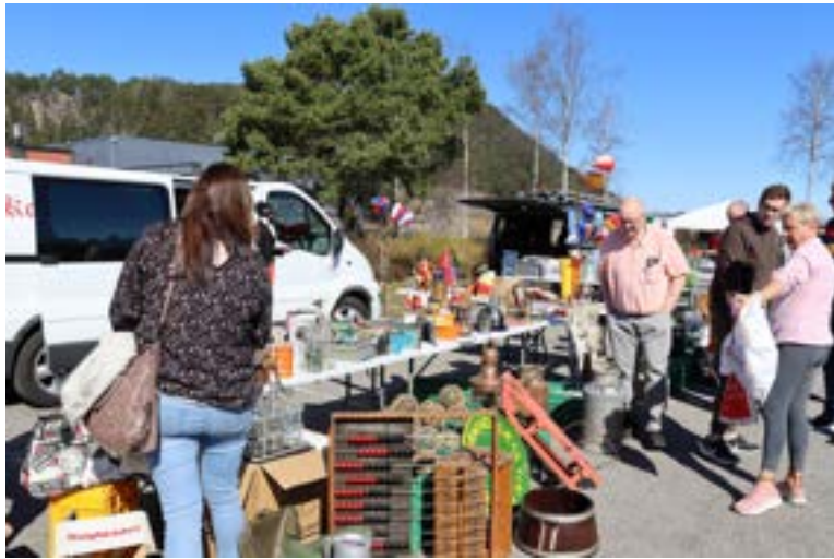
Inne på markedet var det mye rart og sikkert noe for et hvert hjerte.