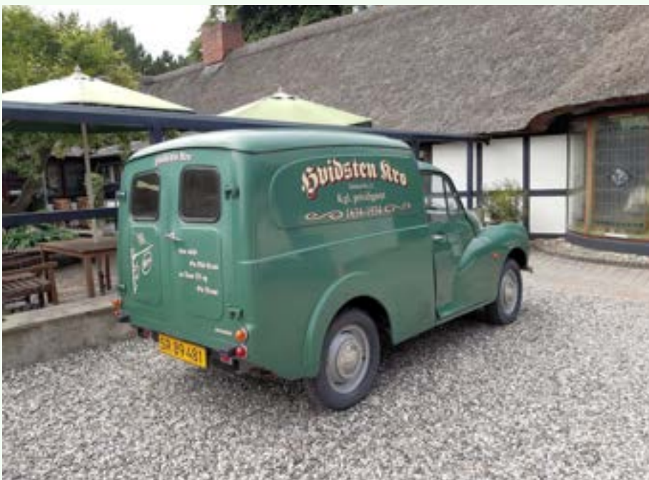
Morris Traveller—stilig firmabil