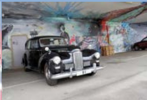
Bilene hviler etter prosesjonen. Per sin Mustang har også kommet til.