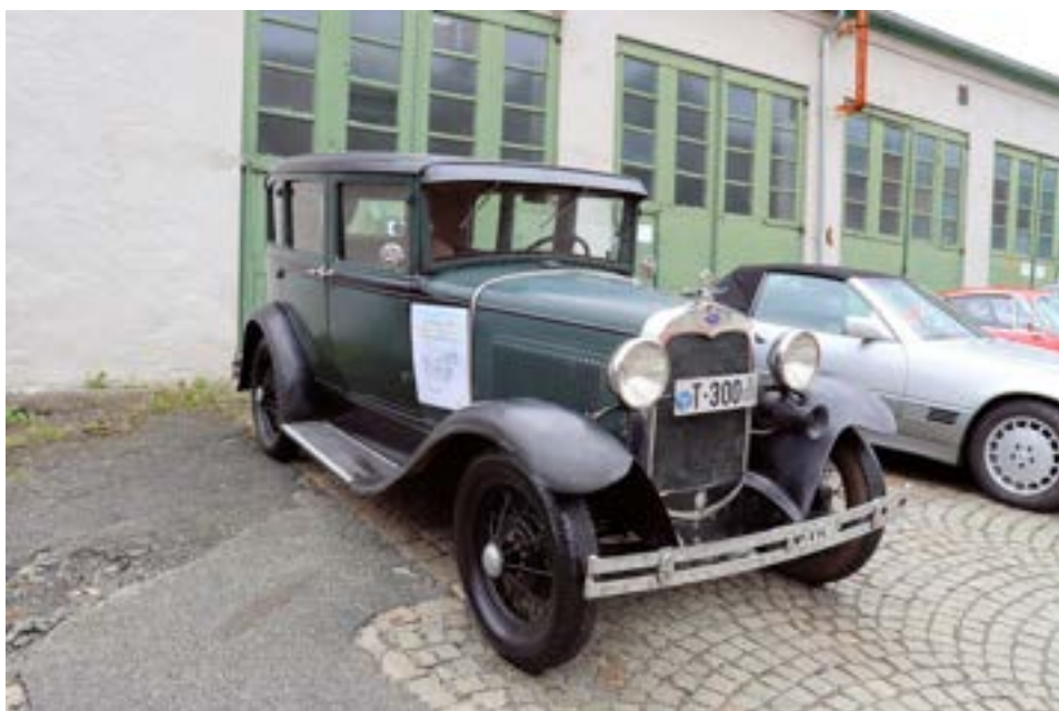
Denne bilen hadde tatt turen fra Norheimsund. Ford model A 1930.

sluddet og kanskje snødde. Så 3 biler var vel nesten imponerende. Impone- rende var dog ikke oppmøtet fra BVK. Mener vi til slutt talte 15 biler, noe som er langt under hva vi burde ha vært på en dag med opplett vær. Spørsmålet vi stiller oss i ettertid er om årsaken til svakt oppmøte er at vi