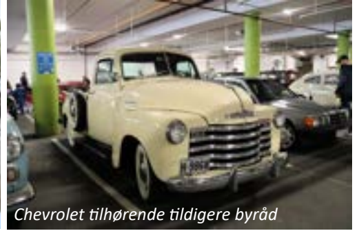
Chevrolet tilhørende tidligere byråd Helge Stormoen