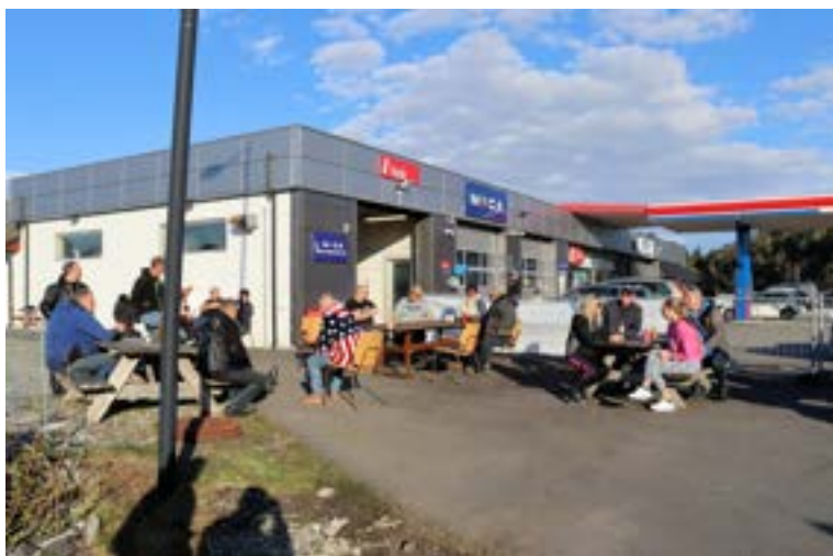
Folket koser seg i ettermiddagssol.