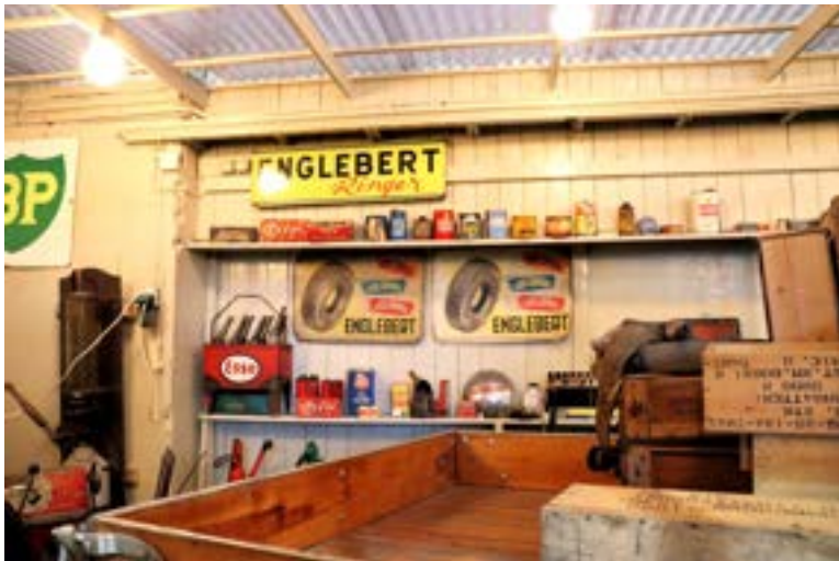
Mange fine detaljer inne i «BVK-garasjen» inne på museet