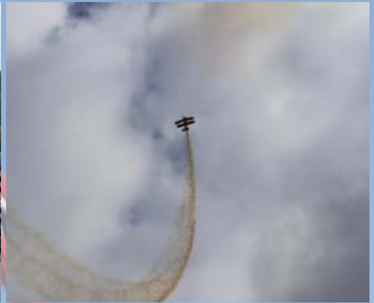
Håkon Fosso i en av sine halsbrekkende oppstigninger!