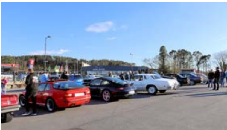
Porscher og amcars i skjønn forening.