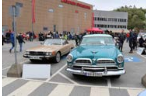
Røens SL og Trelleviks Chrysler