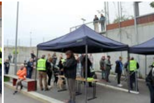
Folket i billettsalget hadde jevnt og trutt med arbeid

høvding» er borte, det vitner om en veldrevet organisasjon.