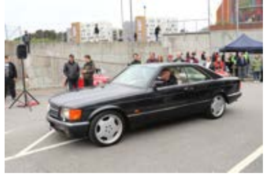
MB: Har ikke navn, men flott S-coupé.