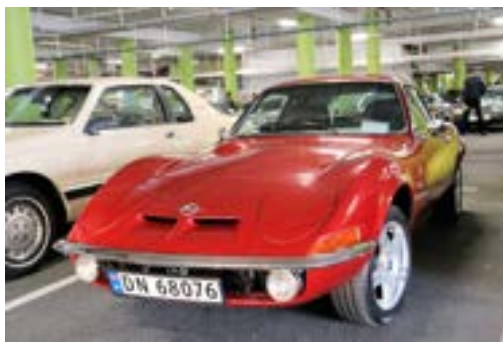
Opel GT i våre rekker! Imponerende!