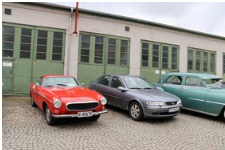
Volvo P1800 fra Kvam Veteranvogn Klubb. Usikker på Vectraen...