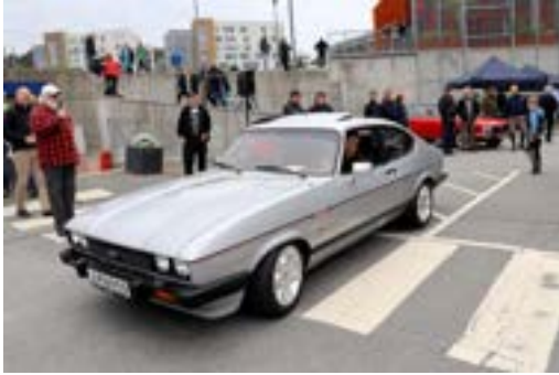
Capri: 2,8i 1983: Jan-Olav Nordbø.