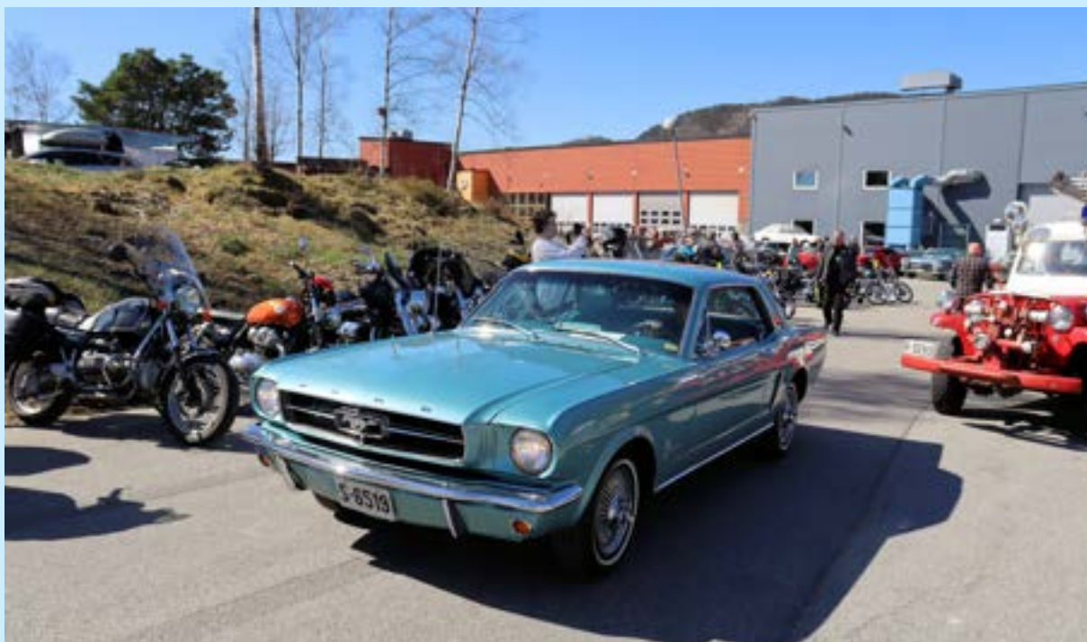
Nydelig 1965 Ford Mustang på vei ut fra Ulvenmarkedet. Fantastisk farge. Tenke seg til at jeg valgte bort den fargen på min 1967 Fastback tilbake i 2003. Ja, dette var originalfargen. Hadde ikke skjedd i dag.