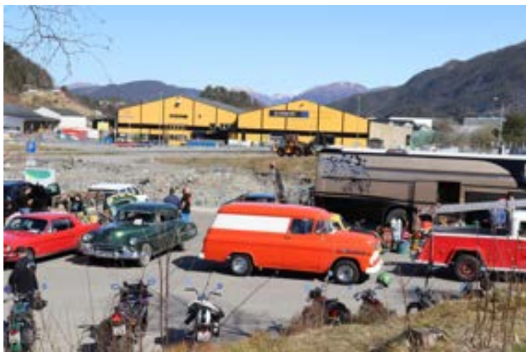
Et knippe yrkesbiler var det også.