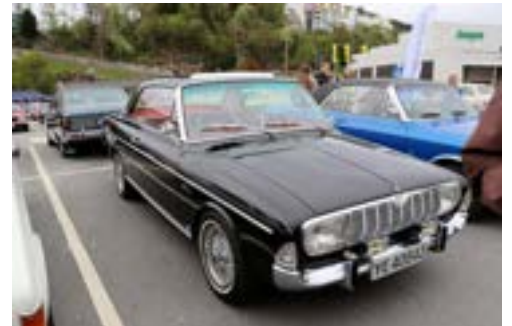
Morgan, Mustang, Capri og nydelig Ford Taunus 20M TS Hardtop