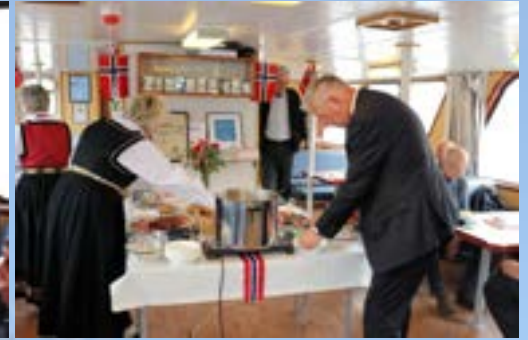
Det ble pratet og spist og det var god stemning.