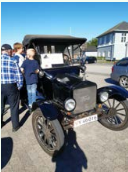
Ford T i Hobro