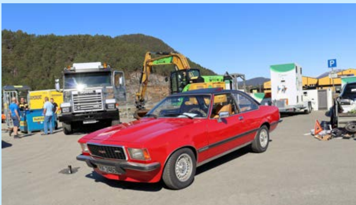
Nok en flott Opel på Ulven. En riktig flott Commodore. Jeg husker vi siklet etter disse da vi var unge. Men det var ikke oppnåelig for en ungdom på slutten av 70 tallet.