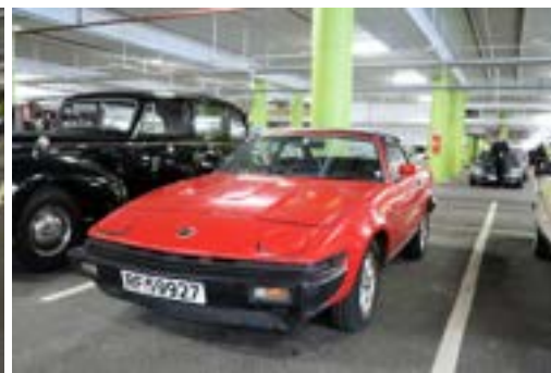
Jetmundsen kom med sin Triumph