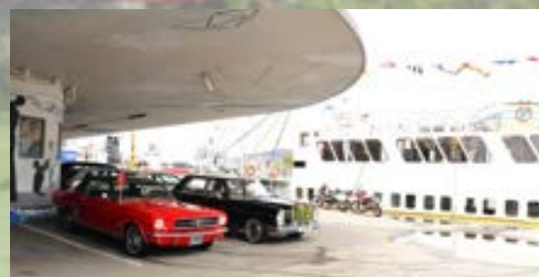
Mustang, Mercedes, MC'er og båt. Alt på plass!