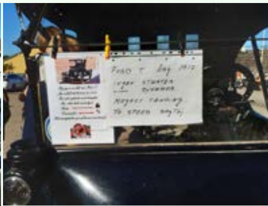
Ford T data