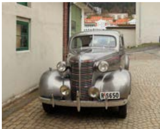
Sigve Carlsen med sin flotte 1938 Chevrolet