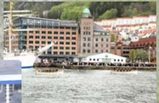
Kaproningen i full gang.