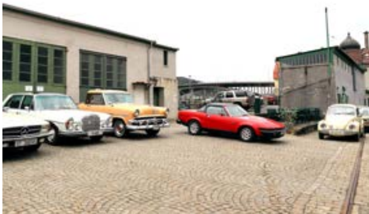
Noen av BVK bilene