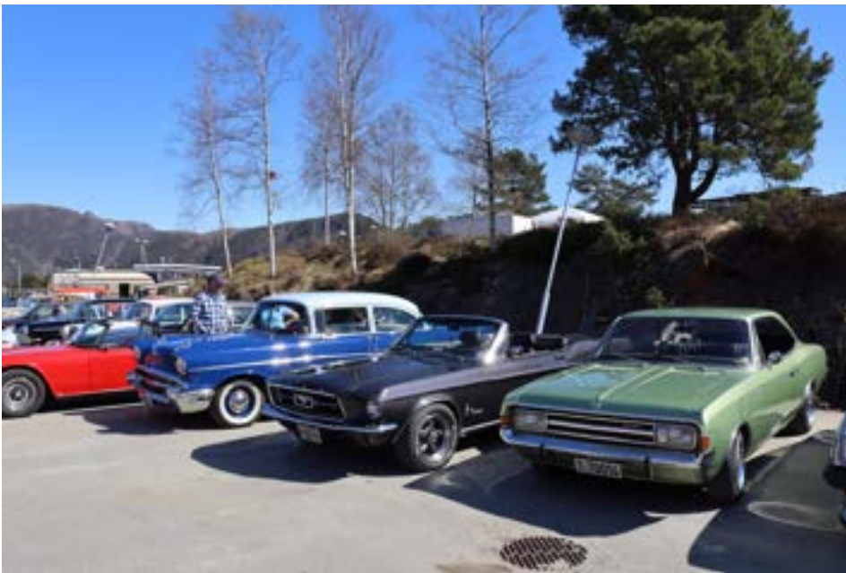
Enda en fin Opel Coupe samt flott 1967 Mustang Convertible og en mer kjent 1957 Chevrolet.

Skogsvåg Auto er ivrige deltakere på samlinger gjennom sesongen. BVK planlegger en tur til de i løpet av sommeren.