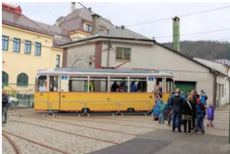
Det var som vanlig stor pågang til trikketurene