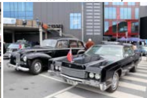
Humberen ble flyttet ut til sin «kompis» Lincoln. Kongebilene samlet.