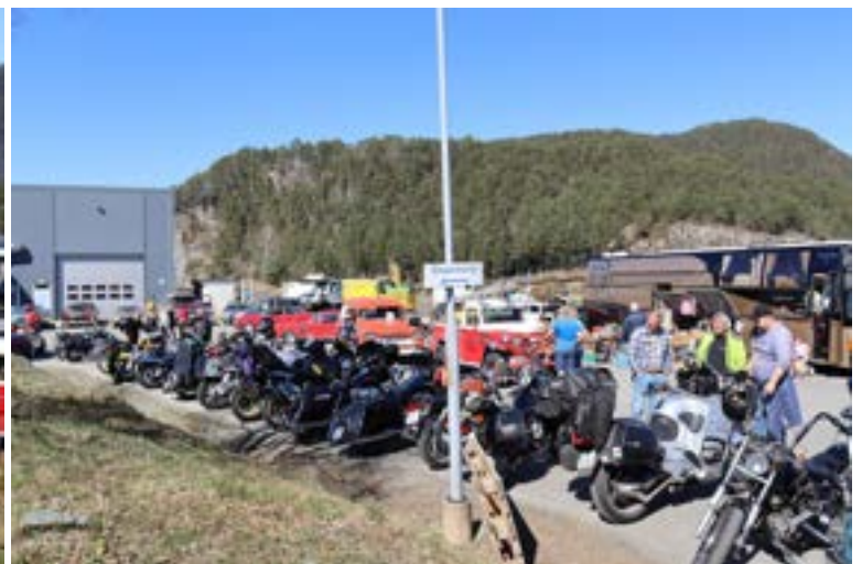
Godt oppmøte av to-hjulinger også!

her var det jo en velsignelse med været. Da kan arrangøren ha benker og bord ute på området og folk sitter i solen og koser seg. Finbil parkeringen var også gøy å gå rundt i. Mange fine biler og alltid gøy å se noen man ikke kjenner så godt. Merket meg