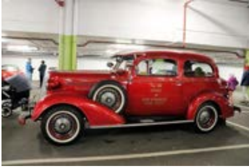
Remy Rafsol sin Chevrolet 1936