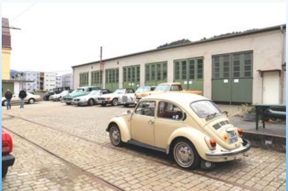
Fra årets første medlemsmøte ute under åpningen av BTM 23. april.

16. - 21.08: Danmarkstur. Nyoppsetting av turen som ble kansellert i 2020.