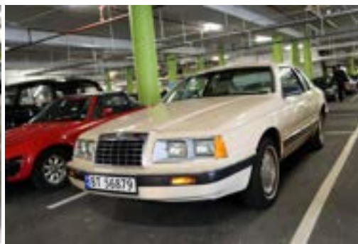
Joda, jeg var der jeg også.....