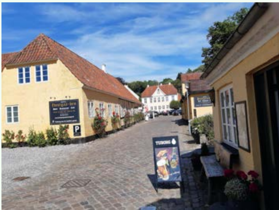
Mariager hovedgate, rådhuset og torget øverst

Det var «Dolly» som ble lastet opp denne gang og glinsende blankpolert gikk turen med færgen, som danskene sier, ned til Hirtshals og så var det landeveien sydownover til Rebild i Rold Skov. Her var jeg invitert til gullbryllup hos gode venner; frokost på kroen som varte fra kl 12 til 1830! Så gikk veien til Mariager hvor jeg fikk en god plass til teltet kloss ved veteranjernbanen og fjorden utenfor. I dagene som fulgte ble det småturer langs fjorden, til veteranbilsamling på kaien i Hobro innerst i fjorden, besøk på Hvidsten Kro syd for Mariager som