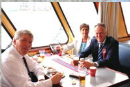
Vi koser oss her!