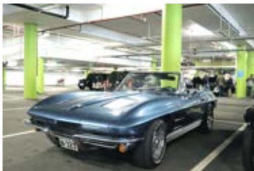
BVK medlem Bendik Nordanger stilte med denne superflotte Chevrolet Corvette 327 1963. Også en uvanlig vogn hos oss.