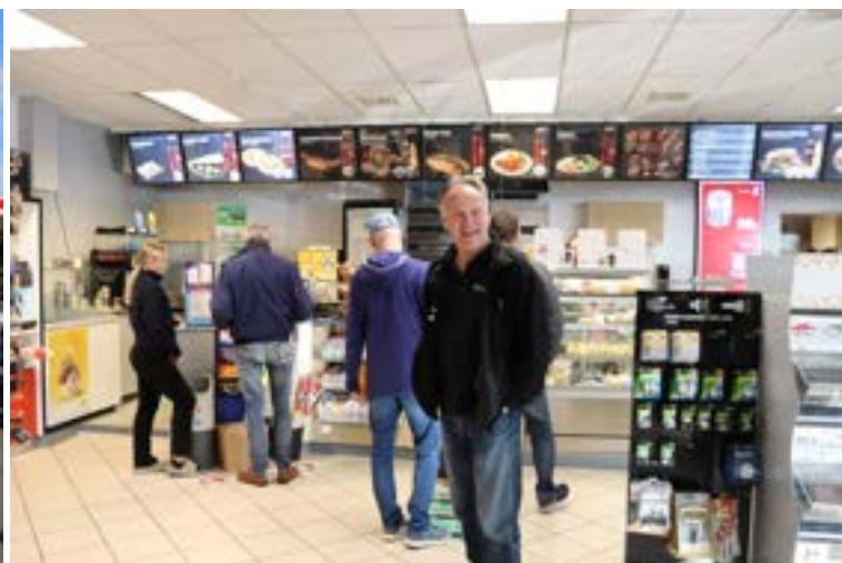
Redaktøren gleder seg til en god soft-is.

Toyota Carina via gamle klassikere til moderne spesielle biler. Og, ikke å forglemme, mange motorsykler. Noe for enhver smak med andre ord.