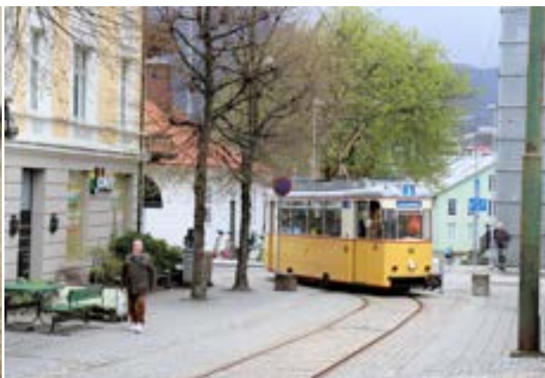
Trikken runder hjørnet opp mot museet