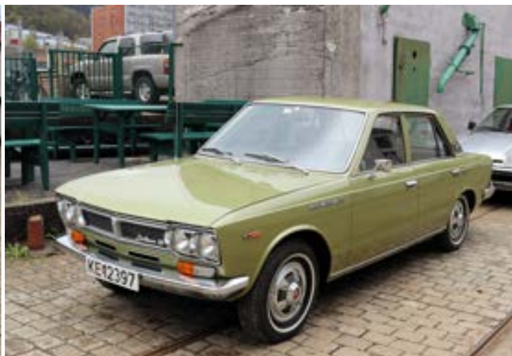
Kjetil Sylta stilte med sin flotte Datsun 1800—1971