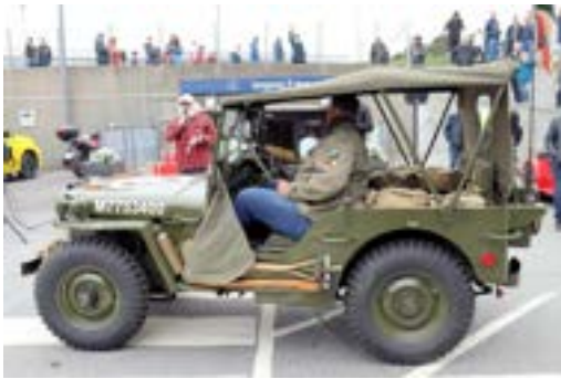
Beste Militær. Vet dessverre ikke navnet.