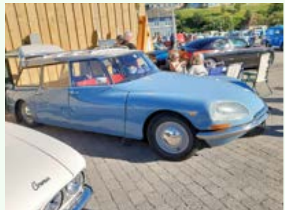
Neste generasjon etter Citroen 11

tilbake etter krigens slutt. Kroen er vidt kjent for sin eggekage, omelett, og den er god!!! Hele Mariager Fjord er et fantastisk flott område som jeg besøker når jeg kan og jeg anbefaler et besøk der. I Fir-