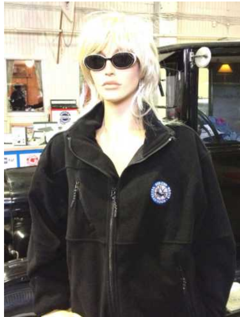
Fleecejakke: kr. 400,-