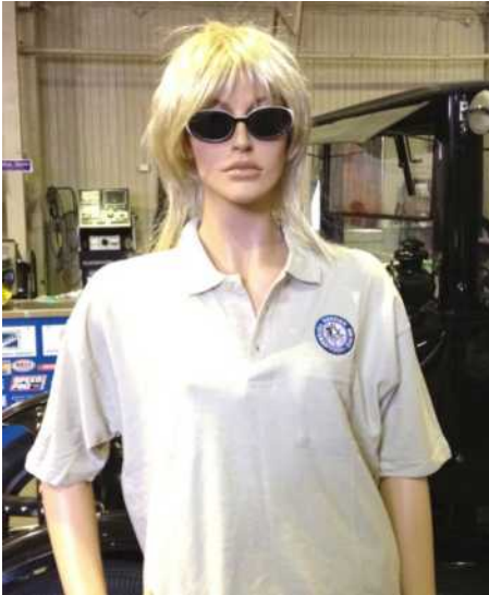
Pique skjorte: kr. 125,-