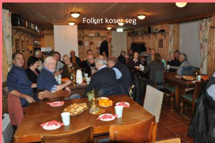
Folket koser seg