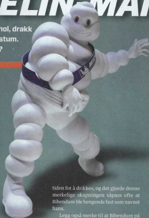
Michelin-mannen og to slitne konkurrenter.

tiden for å drikke», og det gjorde denne merkelige skapningen såpass ofte at Bibendum ble hengende fast som navnet hans.