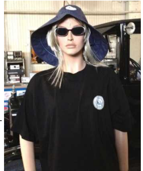
T-skjorte: kr. 100,- Sydvest: Utsolgt