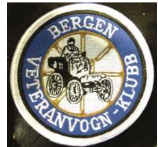
Jakkemerke: kr. 75,-