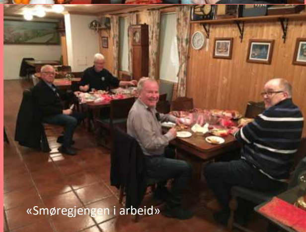
«Smøregjengen i arbeid»