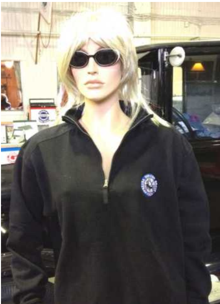
Genser med ny logo: kr. 350,-