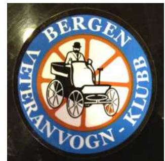
Klistremerke: kr. 10,-