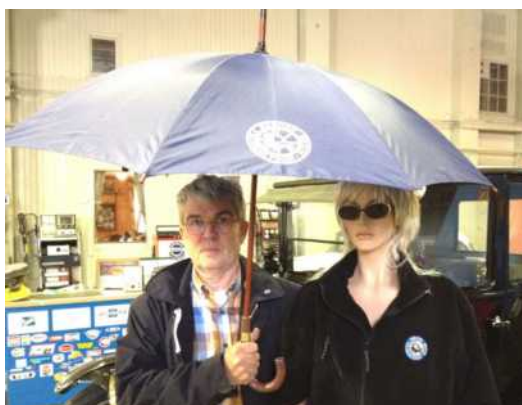
Paraply: kr. 150,-