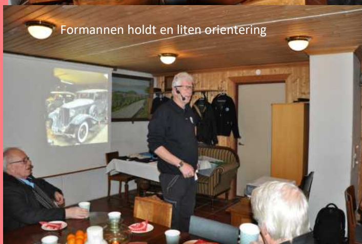
Formannen holdt en liten orientering