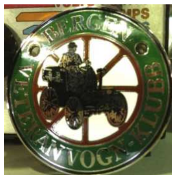
Vognmerke: kr. 300,-