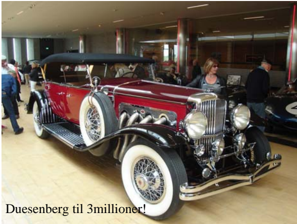
Duesenberg til 3millioner!