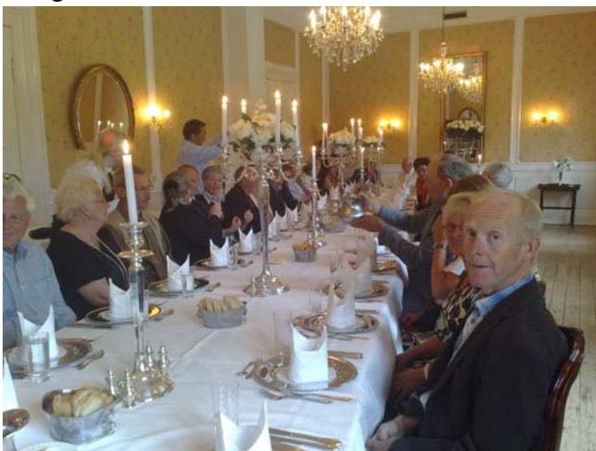
Middag på Sophiendahl Slotshotell.

Neste dag kjørte vi nordover til Sophiendahl slotshotell. På veien besøkte vi en privatmann som