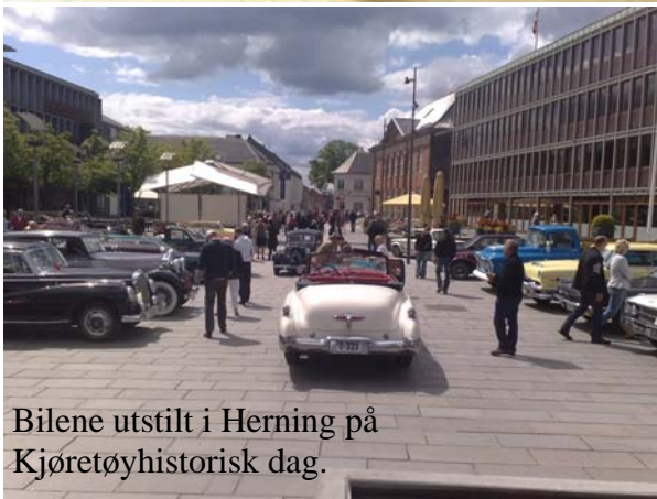
Bilene utstilt i Herning på Kjøretøyhistorisk dag.