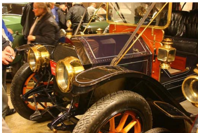
Detaljer på en gammel kjenning fra utstillingen i 2007: Cadillac 1911

Referatet fra den andre gruppen ville vel blitt identisk, men i motsatt rekkefølge..