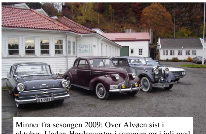
Minner fra sesongen 2009: Over Alvøen sist i oktober. Under: Hardangertur i sommervær i juli med "Hop Veteranvogn klubb"