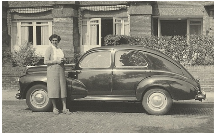
Stilig dame med Peugeot.