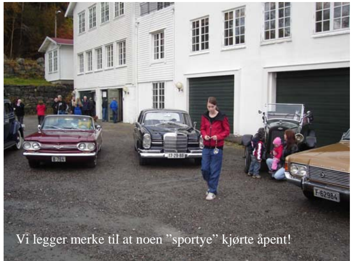
Vi legger merke til at noen "sporty" kjørte åpent!

General Motors-forhandleren vil gjerne vise Dem alt sammen og gi Dem tilbud på nettopp den modell og type, som vil passe best for Deres spesielle formål.