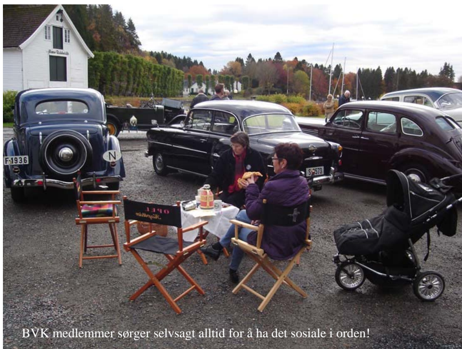
BVK medlemmer sørger selvsagt alltid for å ha det sosiale i orden!