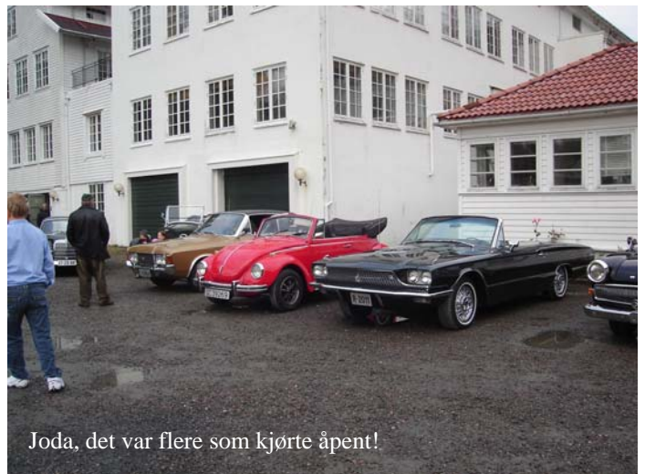
Joda, det var flere som kjørte åpent!

Mange ville stille med kjøretøyer - dersom været tillot det. Og været var på vår side - ikke en dråpe regn. 18 kjøretøyer stilte opp til stor glede for et hopetall med fremmøtte - som ikke bare fikk oppleve det kulturelle mangfoldet i Alvøen