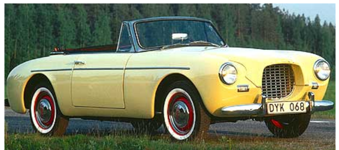
Kjapp og gul. Volvo Sport.

På 50-tallet ble Volvo ansett som en produsent av robuste bruksbiler. Sport og spenning var ikke det man assosierte med merket. Det skulle volvogrunder Assar Gabrielsen forandre på – trodde han.