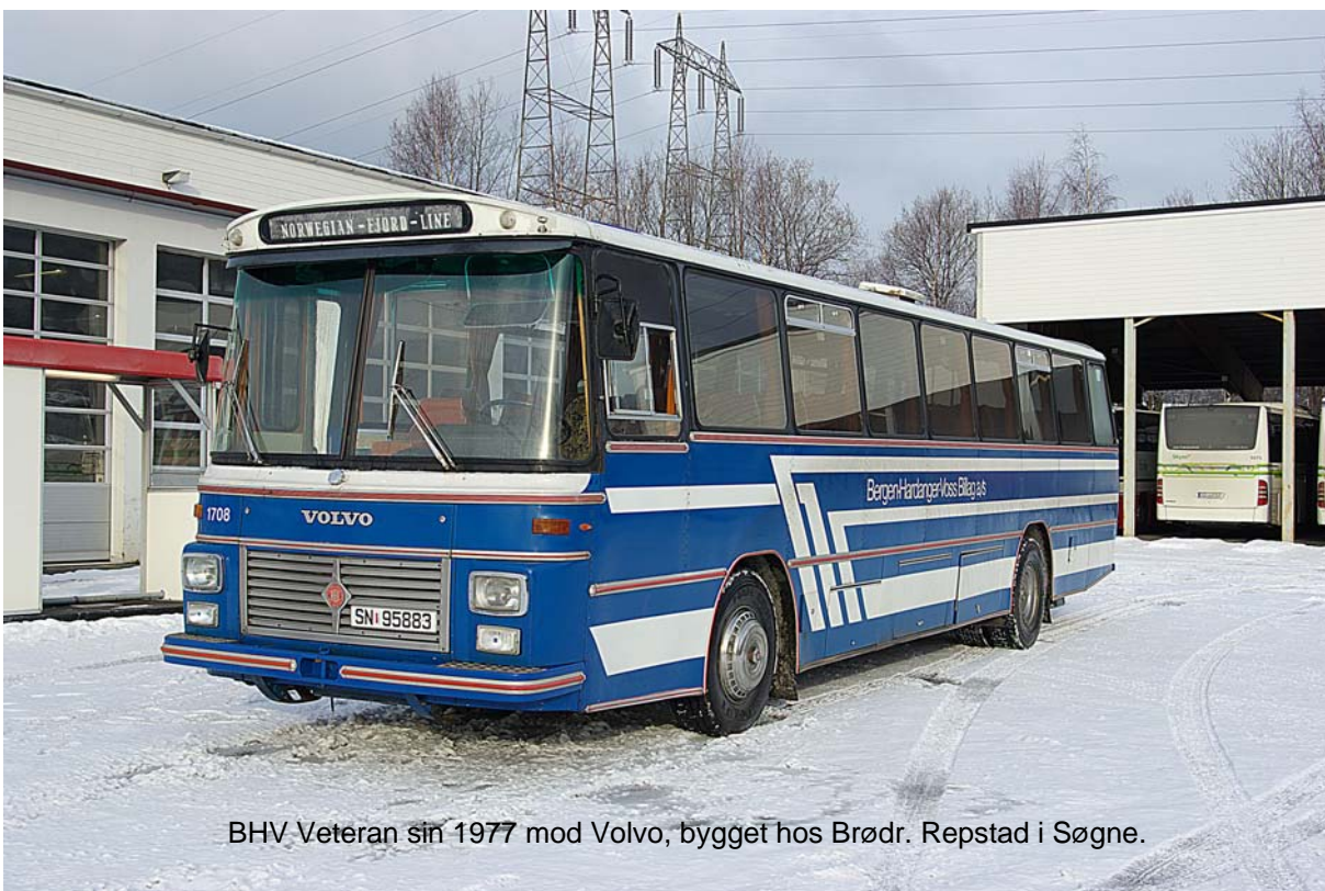
BHV Veteran sin 1977 mod Volvo, bygget hos Brødr. Repstad i Søgne.