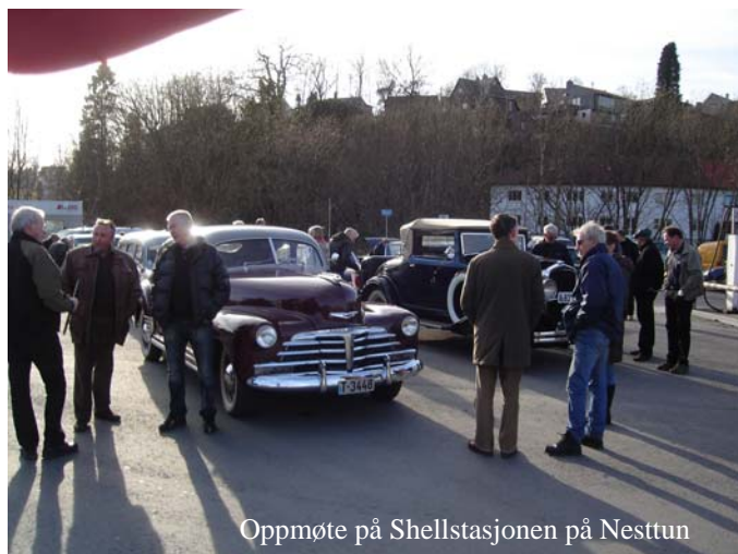
Oppmøte på Shellstasjonen på Nesttun