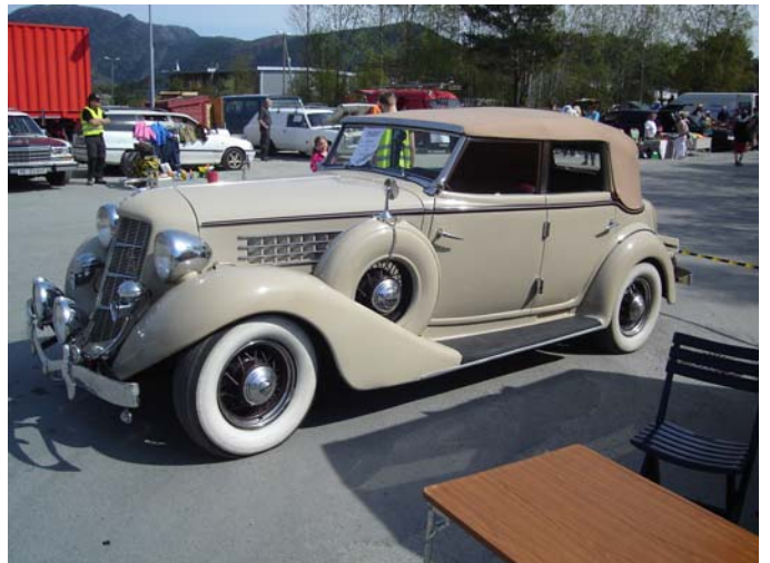
Gustav Bahun sin stilige Auburn! Fantastisk bil!