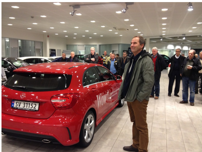
Den nye A-klassen fikk mye positiv omtale av BVK'ere

Han la frem møteplanen fremover og informerte om at på Sjøkrigsskolen der vi skal i januar vil de ha påmelding. Dette må vi bare forholde oss til og de som vil ha med seg dette må melde seg på. Det blir et flott opplegg der man får teste skipssimulatoren etc..