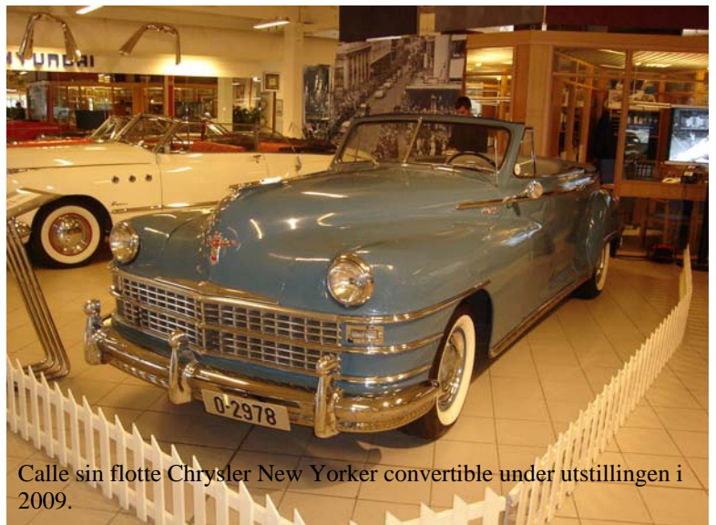
Calle sin flotte Chrysler New Yorker convertible under utstillingen i 2009.