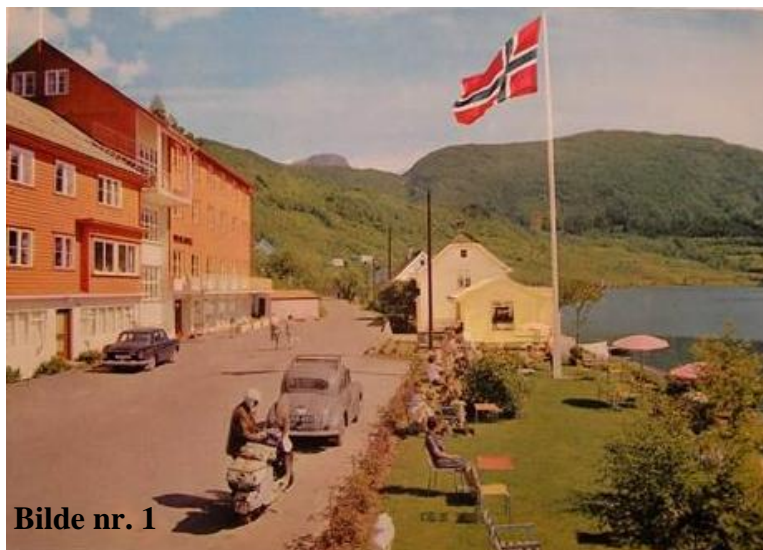
Bilde nr. 1