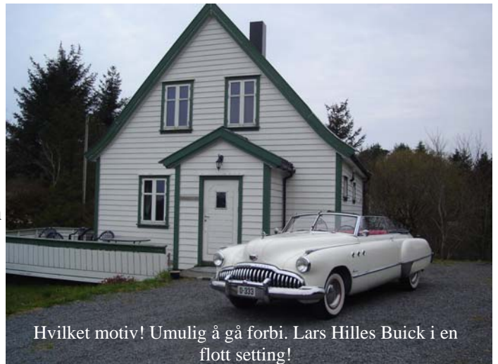
Hvilket motiv! Umulig å gå forbi. Lars Hilles Buick i en flott setting!