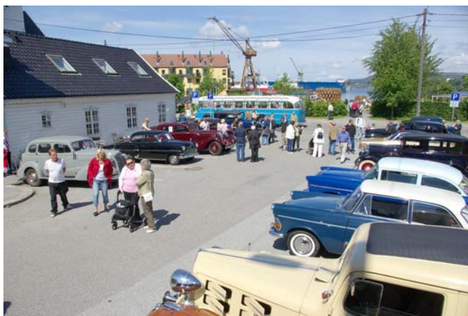
Bilde fra fjorårets arrangement.

Med gammelbilhilsen Per Fiksdal/Arild M. Nilssen