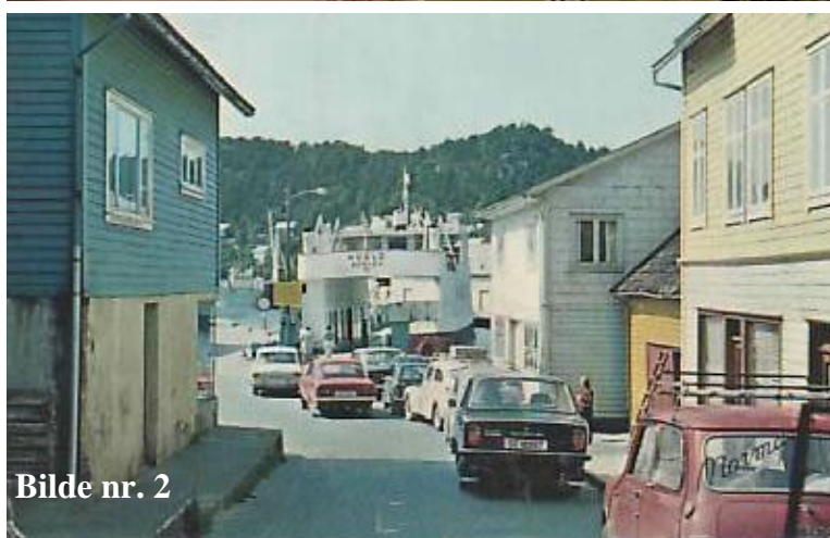
Bilde nr. 2