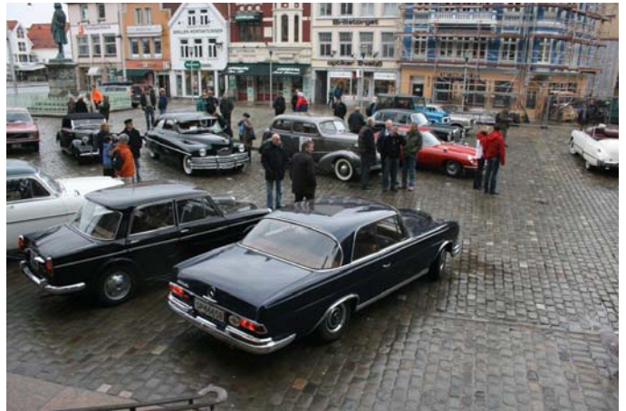
Fra Vågsalmenning. Noen av bilene.