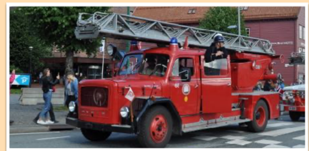
En slik Magirus skal være gjest ved BTM i 2024

Vi tenker å flytte litt på museets biler. Den gule Mercedes lastebilen vil bli tatt ut, og erstattet med en stigebil fra Bergen Brannvesen Historielag. Vi tror det kan bli et populært innslag i kommende sesong.