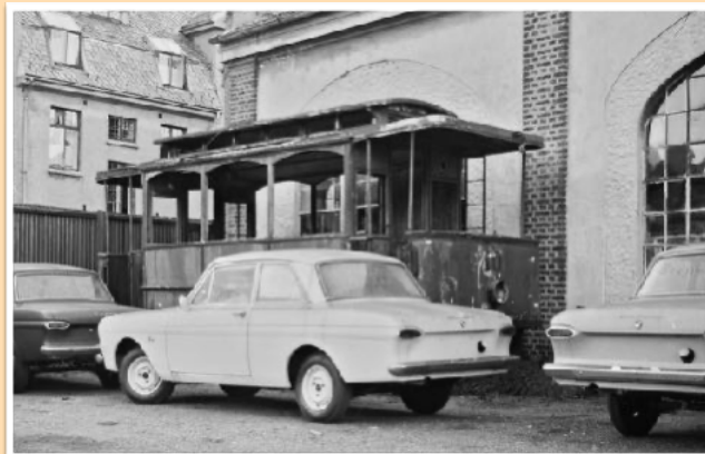
Slik nummer 10 overlevde bak Trikkehallen.