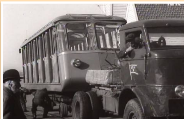
Denne har vi. Her fra transporten i 1954