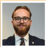
Kulturbyråd Reidar Digranes

BTM ble invitert til møte med kulturbyråd Reidar Digranes, den 16. februar. Undertegnede stilte på vegne av BTM, og fikk presentert våre aktiviteter. Byråden var imponert over besøkstall, dugnadsinnsats og aktiviteter ved museet.