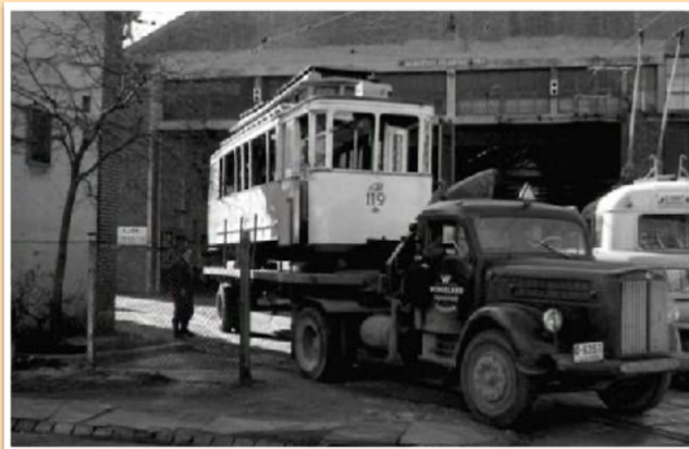
Bort med dritten.....