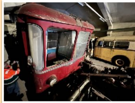
Fra lageret på Garnes

Målsettingen er stadig å bytte ut en av dagens vogner med den norskbygde fra 1954. Det har