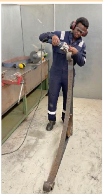
Elev ved Slåtthaug VGS legger siste hånd på verket på utriggerne til trikkemastene i Teaterparken

BES har hatt jevn aktivitet gjennom hele vinteren. Miljøet er aktivt og jobber målrettet med fullføring av linjen og klargjøring av trikkene før sesongstart.